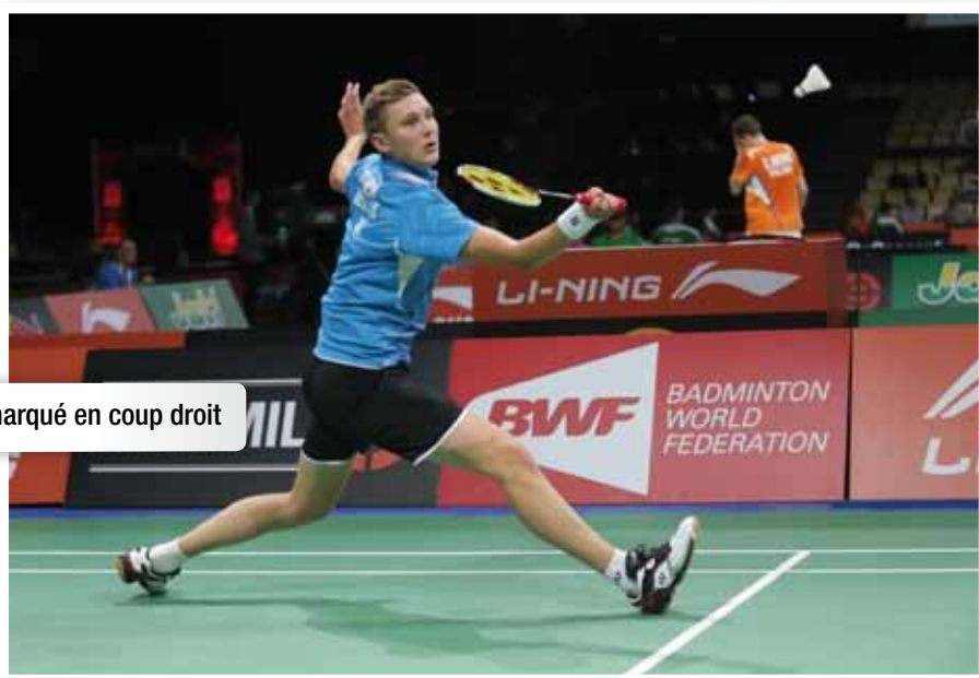
Armé marqué en coup droit