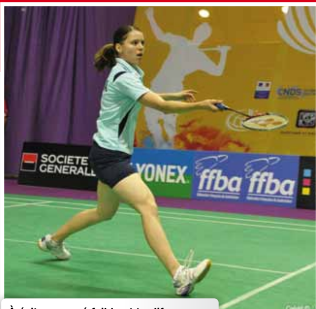
À éviter – armé faible et tardif en coup