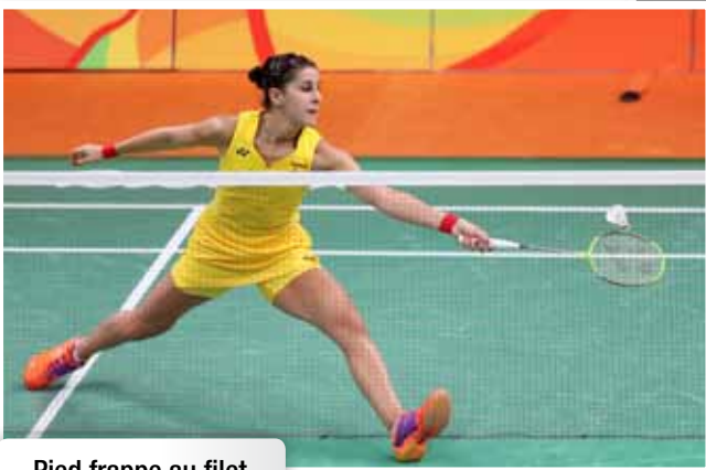
Pied frappe au filet