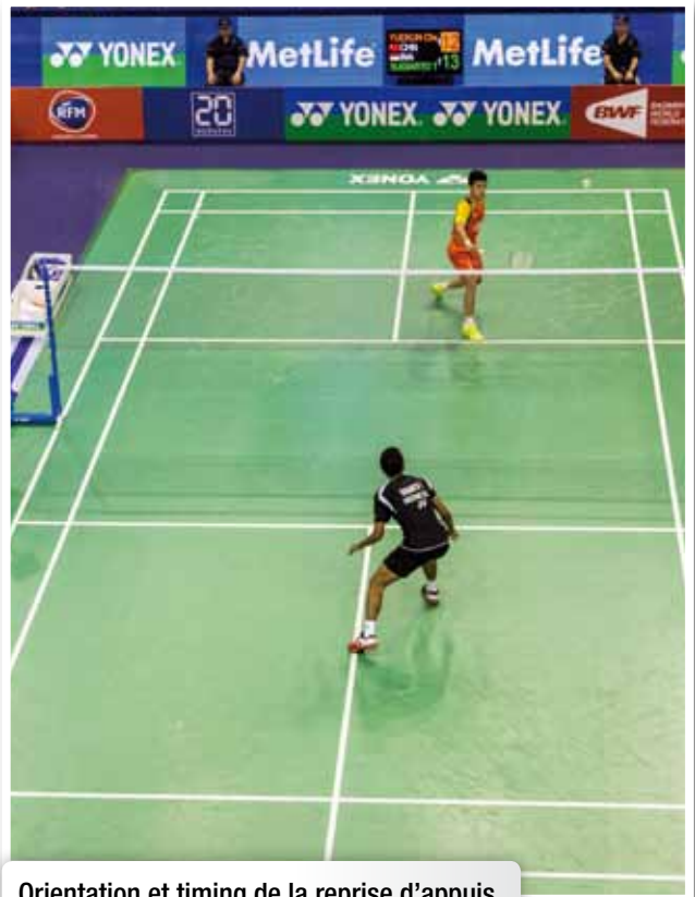
Orientation et timing de la reprise d'appuis