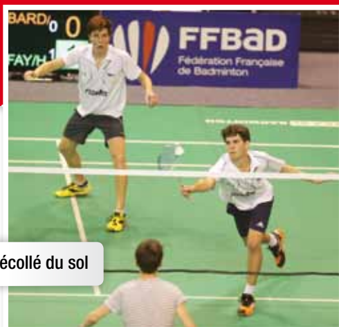
Appui arrière décollé du sol