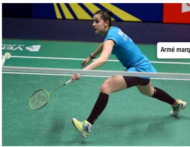
Armé marqué et précoce en revers