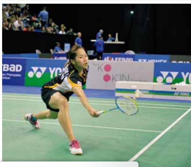
Armé marqué et précoce en coup droit