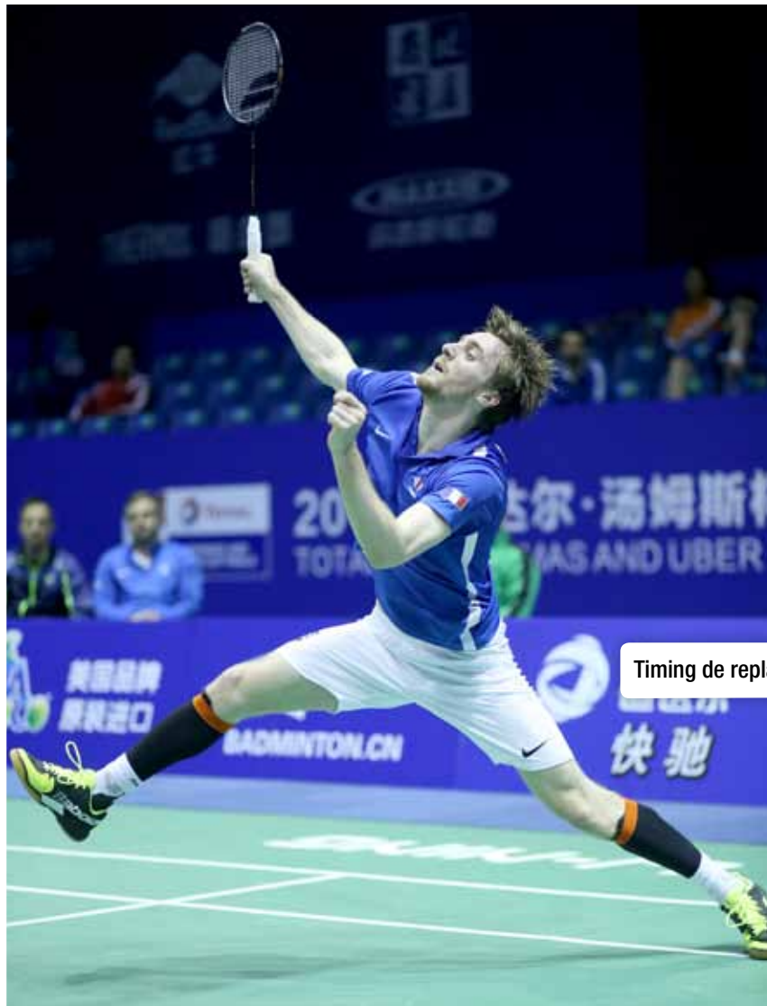
Timing de replacement