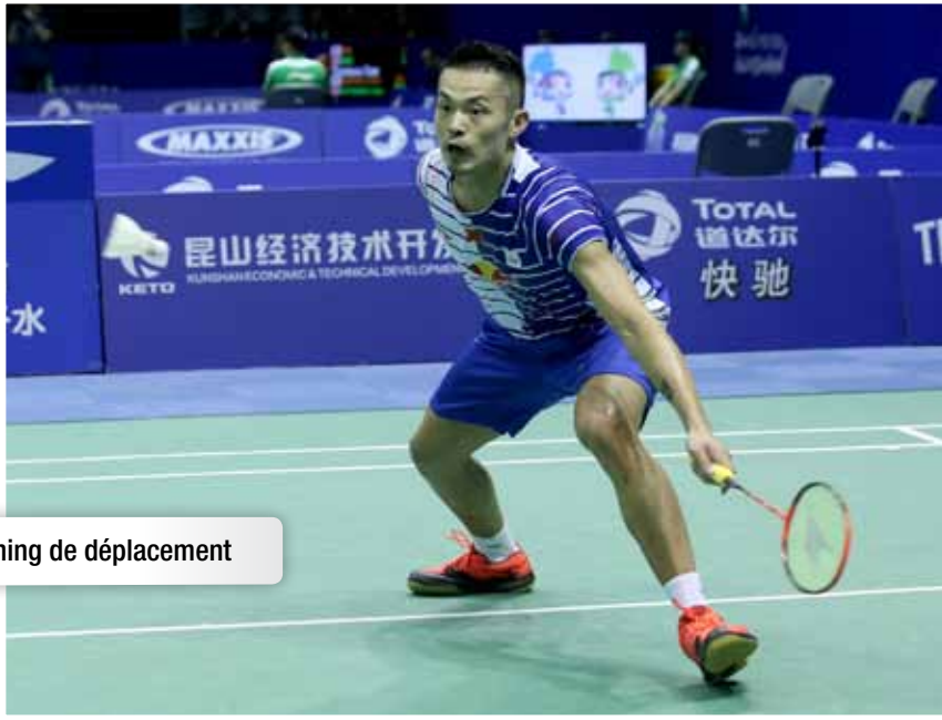
Timing de déplacement