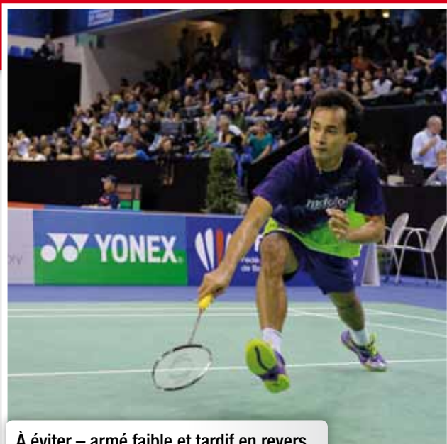
À éviter – armé faible et tardif en revers